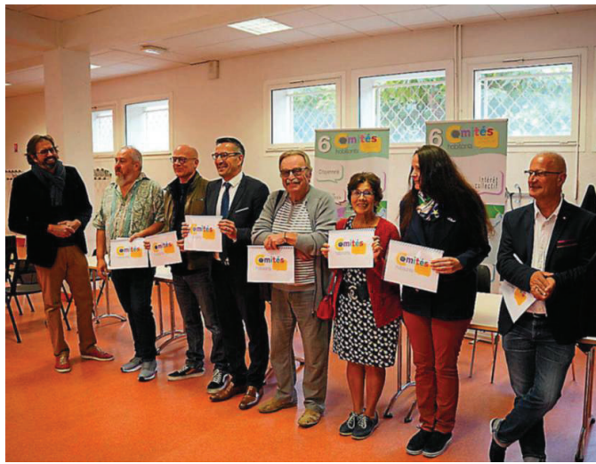
La charte a été signée entre les représentants des comités habitants et la ville de Frontignan.

Les comités habitants : qu'est-ce que c'est ? La transformation des onze anciens conseils de quartier en six comités habitants (Cœur de ville, La Peyrade, La plage, Barrièr-Crozes-Pielles, Au pied de la Gardiole, De la vigne au canal) est le ré-