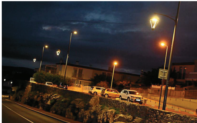
Un arrêté va préciser la date de démarrage, les lieux et les horaires.

Aujourd'hui, la commune dispose d'un parc d'éclairage public de 2 729 points lumineux et de 41 armoires de commandes, alimentés en électricité en moyenne 4 200 kv an, représentant une facture annuelle de 170 000 € TTC. C'est pourquoi, en complément d'un programme de rénovation énergétique de l'ensemble des équipements inscrits dans le plan pluriannuel d'investissement 2020-2026, la Ville avait aussi engagé depuis 2021 « une ré-